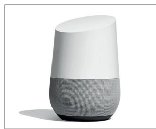
Abb.: Google Home, Quelle: Google