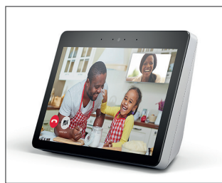
Abb.: Amazon Echo 8