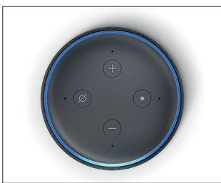
Abb.: Amazon Echo Dot, Quelle: Presse-Kit Amazon

Als Smart Speaker wird ein Lautsprecher bezeichnet, der als Hardware dient und auf dem ein beliebiger Sprachassistent zum Einsatz kommt.