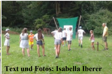
Text und Fotos: Isabella Iberer