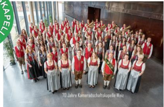
70 Jahre Kameradschaftskapelle Weiz