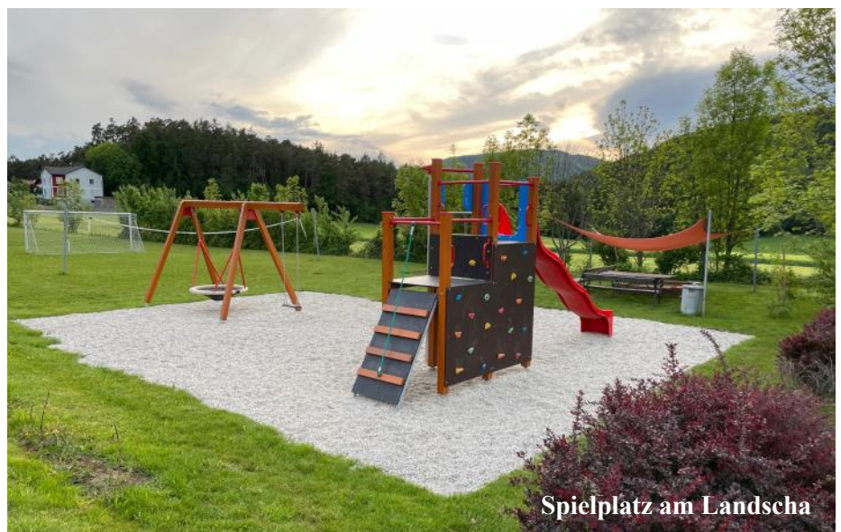
Spielplatz am Landscha

Alle Familien sind herzlich eingeladen, unsere verschiedenen Spielplätze zu besuchen.